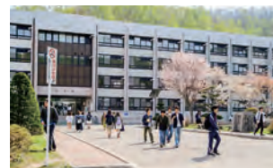
国立大学法人 小樽商科大学