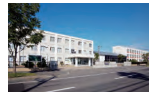
北海道職業能力 開発大学校